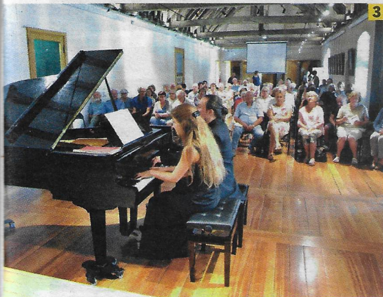
3 ASSOCIATION RENAISSANCE DE L'ABBAYE DE CLAIRVAUX